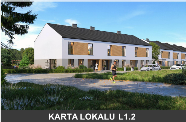
KARTA LOKALU L1.2